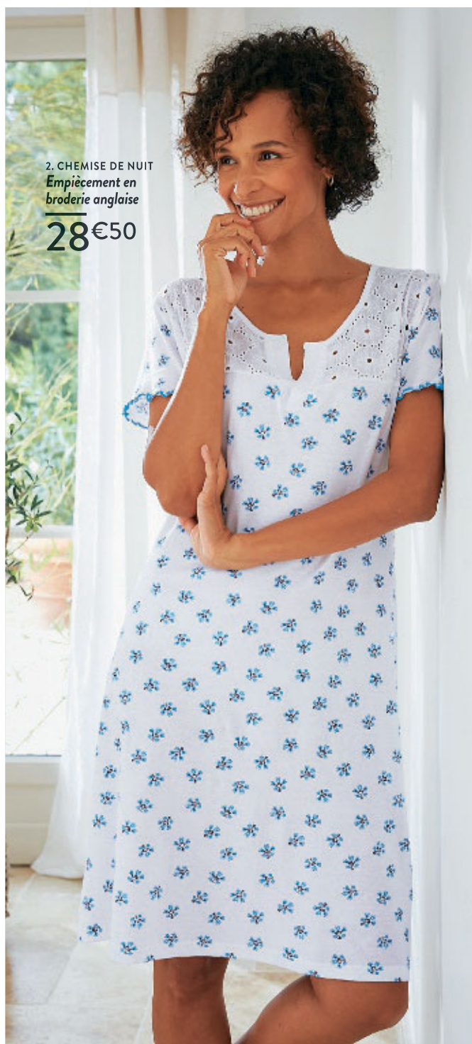
2. CHEMISE DE NUIT Empiècement en broderie anglaise