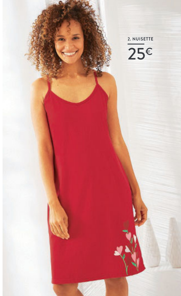
2. NUISSETTE 25€