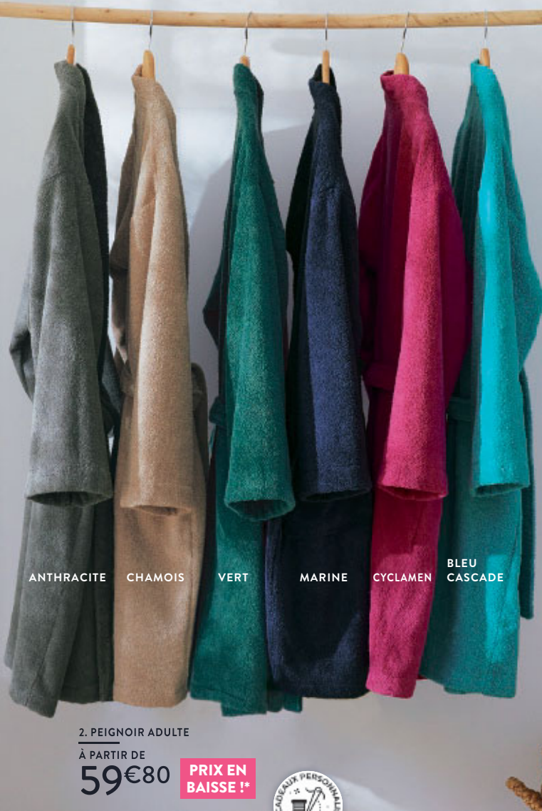
ANTHRACITE CHAMOIS VERT MARINE CYCLAMEN BLEU CASCADE