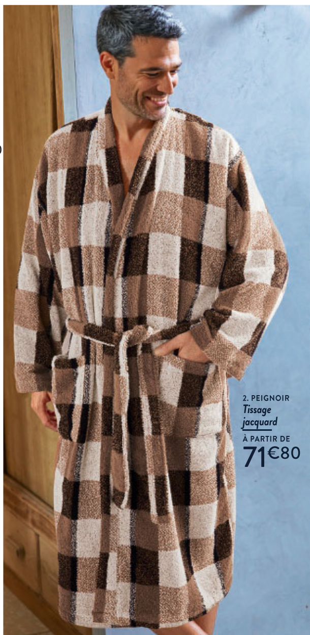
2. PEIGNOIR Tissage jacquard À PARTIR DE 71€80

C'est aussi dans cet univers que le masculin est mis à l'honneur !