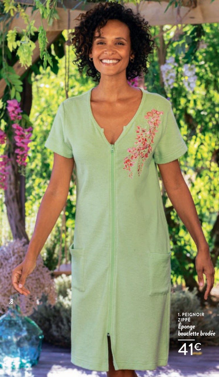
1. PEIGNOIR ZIPPÉ Éponge bouclette brodée