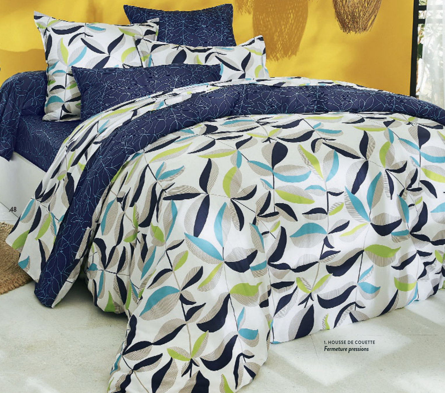
1. HOUSSE DE COUETTE Fermeture pressions