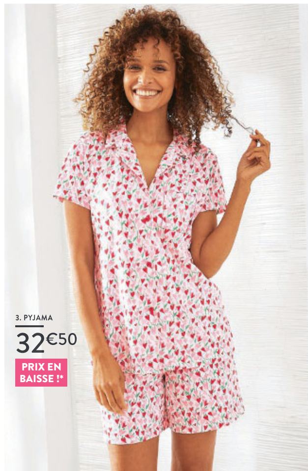
3. PYJAMA 32€50

NOUVEAU : Toute la lingerie de nuit vous est désormais proposée à un prix unique quelle que soit la taille.