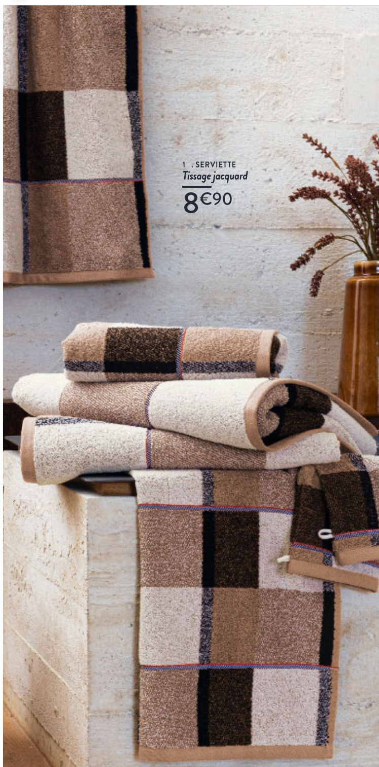
1. SERVIETTE Tissage jacquard 8€90