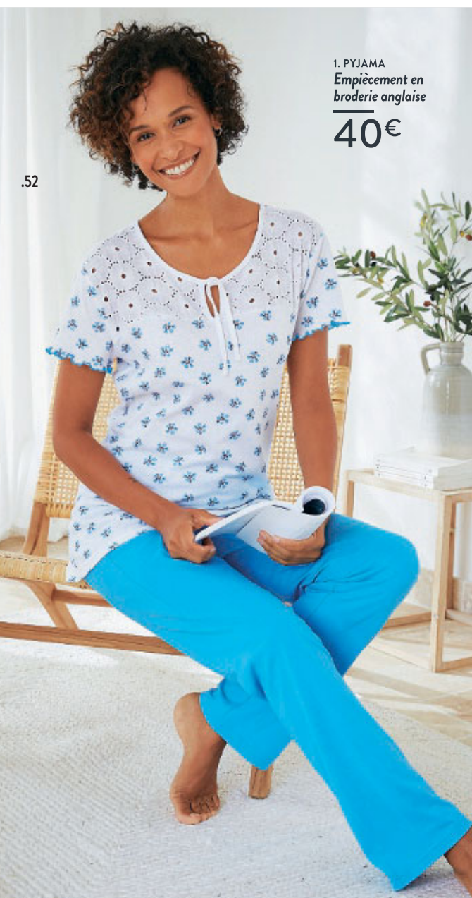
1. PYJAMA Empiècement en broderie anglaise

Dans la tradition du beau linge et du savoir-faire, place aux grands classiques revisités mais aussi à l'innovation avec une toute nouvelle "Boutique du sommeil" au rendez-vous cette saison !