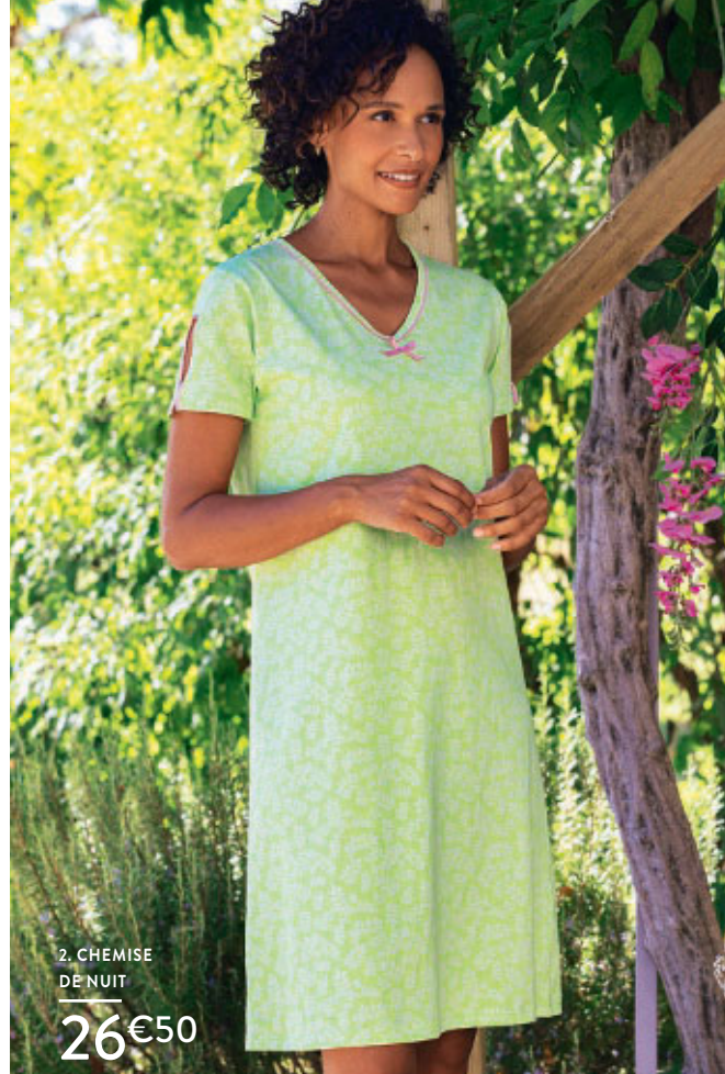
2. CHEMISE DE NUIT

NOUVEAU : Toute la lingerie de nuit vous est désormais proposée à un prix unique quelle que soit la taille.